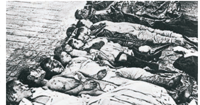
victimas de pogrom / 1905