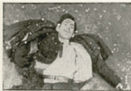
cadaver de striga

(5) Vladimir Lapidus (alias "Striga") nació en 1885 en Minsk, en una familia judía acomodada. Después de terminar sus estudios entra en el partido RSDRP (social- demócrata ), desde 1904 es anarquista, activo en el grupo "Chernoye Znamye" de Bialystok. Después forma el grupo "Komunary", actúa mucho también en Yekaterinoslav, defensor del "terror besmotivny ". Huido de Rusia se establece en París, donde